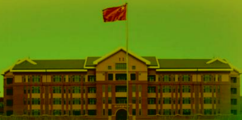
天津机电职业技术学院

TIANJIN VOCATIONAL COLLEGE OF MECHANICAL AND ELECTRICAL ENGINEERING